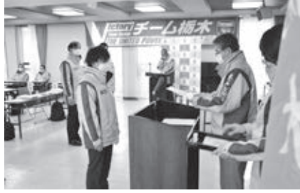
指定証授与式選手宣誓