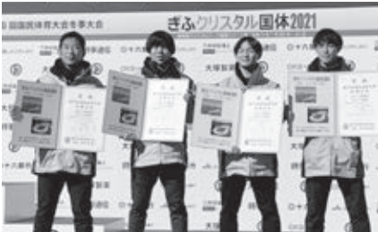
スピードスケート 2000mR