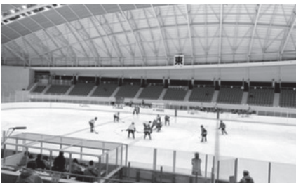
アイスホッケー競技会(少年男子)