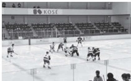
アイスホッケー競技会(成年男子)