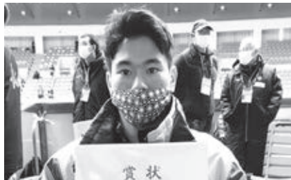
ショートトラック 齋藤慧選手