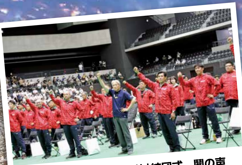
「いちご一会とちぎ国体」結団式 関の声