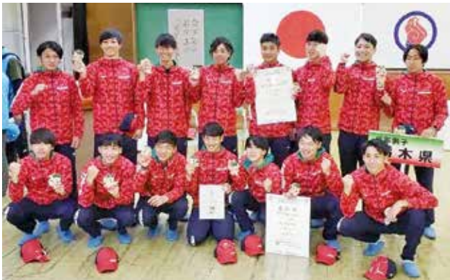
ホッケー競技成年男子 1位 栃木県