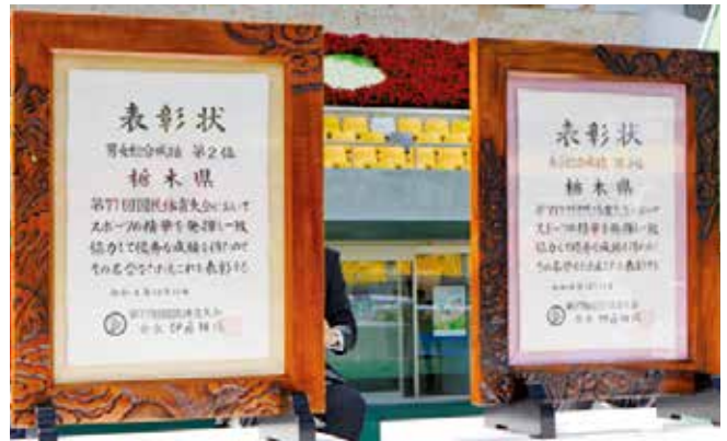
天皇杯2位、皇后杯2位