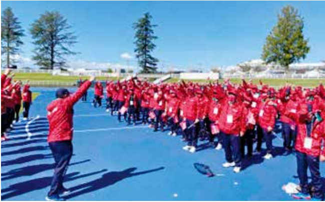
総合開会式 現地激励会の様子