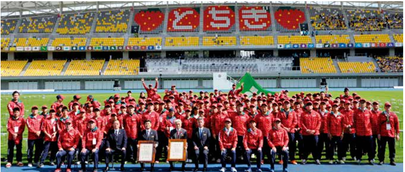
総合閉会式後 解団式の様子