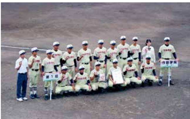
高等学校野球 軟式 1位 作新学院高等学校