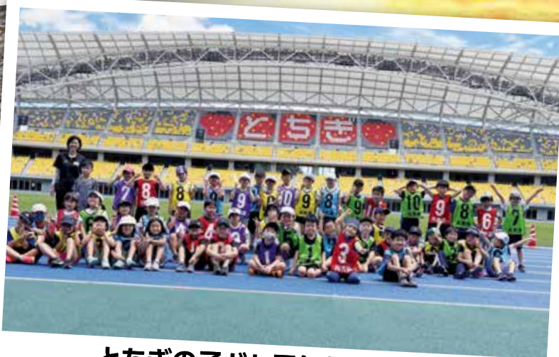
とちぎの子ども元気塾 陸上 (カンセキスタジアムとちぎ)