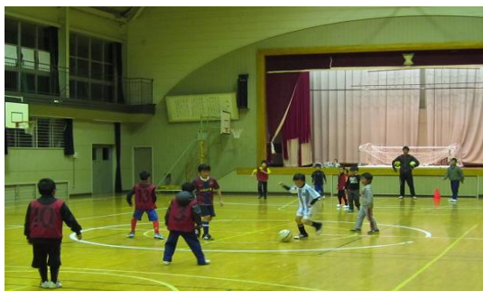
<小学低学年サッカー教室>