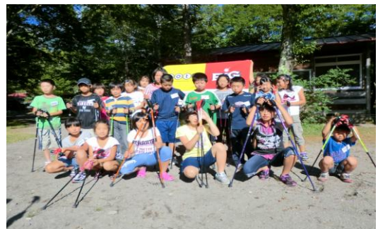
<ノルディックウォーク講習会>