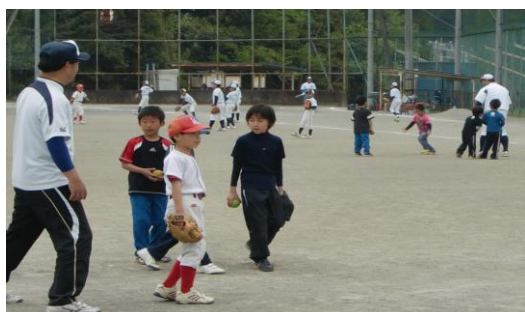
<今年度スタートしたベースボールチーム>