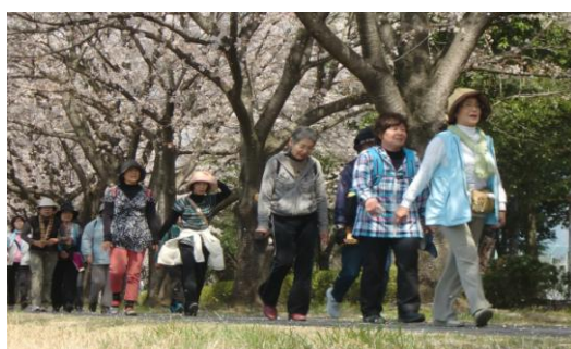
<桜咲き誇る下 健康体操教室ハイキング>